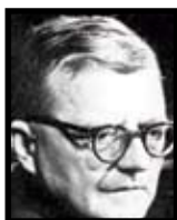
Shostakovitch 100 år