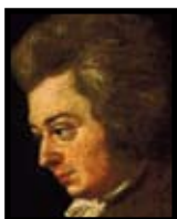
Mozart 250 år

Klassisk Jam Session är en s.k. "Schubertiana" i vår egen tappning. Här ges tillfälle för vår publik att äta och dricka gott, kanske träffa några av kvällens artister och musiker och lyssna till mera musikalisk underhållning, allt under otvugna former.