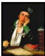
Kraus 250 år